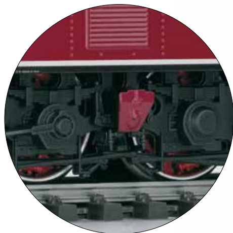
Voorbeeldgetrouwe imitatie van de spiraalveeraangedreven wielen