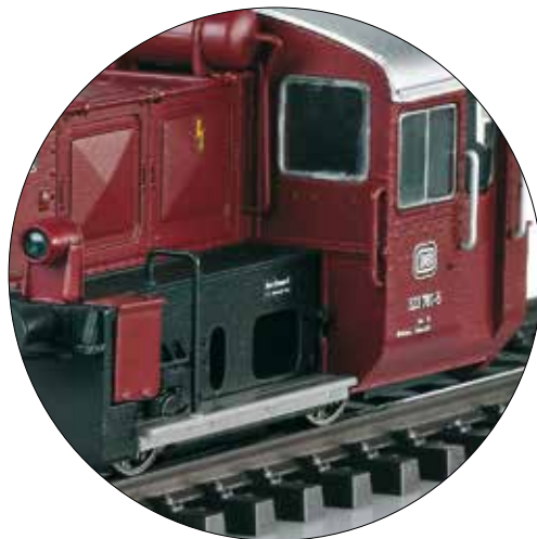
Afzonderlijk gemonteerde metalen handgrepen