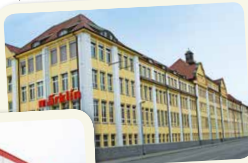
Opendeurdag in Göppingen