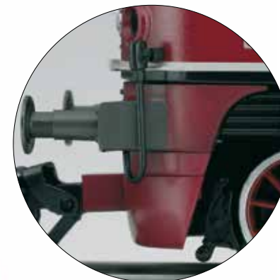
Liefdevol tot in de details omgezet