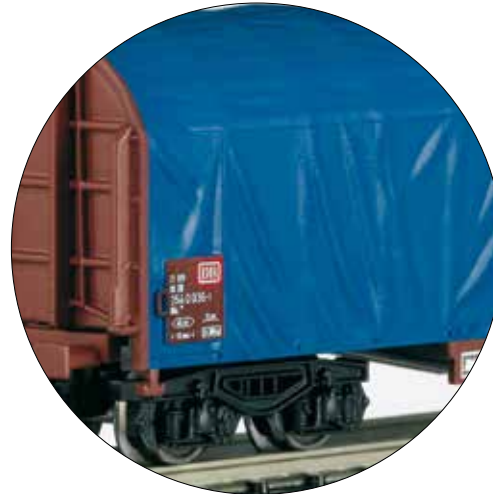
Voorbeeldgetrouw tot op het niveau van de plooiën in de huid